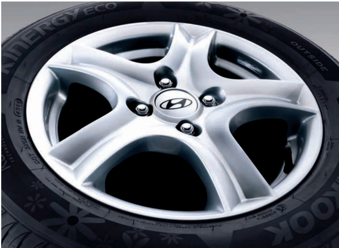
Cerchi in lega 15" Namdo (5 Porte + 3 Porte) 6.0Jx15", adatti per pneumatici 195/65 R15 1J400ADE00

Esteticamente gradevoli quando l'auto è ferma, contribuiscono a migliorarne la guida, riducendo la massa non sospesa della vettura.